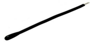
Figure 1: 9900015